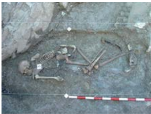
Gorpuak hobitik ateratzen - Elgeta

Ondoren, agiri tekniko hori gorpuzkien analisiaren txostenarekin osatuko da, gorpua identifikatu eta heriotza-kausak zehazteko. Hori guztia arloan espezializatutako laborategietan egingo da.